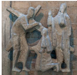
De Goede Herder

Vrouwen aan de kant van de weg rouwen en wenen als Jezus voorbij komt. En het onvoorstelbare gebeurt: ondanks de last, ondanks de pijn ziet Hij hun verdriet en vergeet zichzelf. Hij kan niet anders, Hij kijkt nog steeds met de ogen van zijn hart. Hij huilt met hen en troost hen.