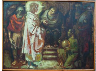
Antonius van Padua

Hij heeft alleen maar goed gedaan, genas mensen, wekte doden tot leven. Hij verkondigde de komst van een rijk van vrede en gerechtigheid, een toekomst vol van Gods liefde. Hij nam geen genoegen met onderdrukking en kwam op voor de rechten van arme en verdrukte mensen, tegen de gevestigde orde in. Maar ze hebben Hem niet willen geloven, Hem beschuldigd van hoogmoed en eigenwaan. De 'Zoon van God' kon Hij niet zijn. Wat volgde was geen rechtvaardig proces, maar een vertoning. De straf was er niet minder om: veroordeling tot de dood aan het kruis.