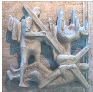
De Goede Herder

De hitte, het stof, het geschreeuw van mensen, het vloeken en schelden van de soldaten... Doodop valt Jezus opnieuw. Maar vastberaden krabbelt Hij overeind, zet zijn schouders weer onder het kruis en sleurt het verder naar Golgota.