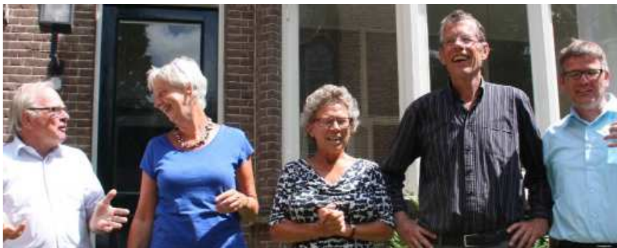
De gezichten van het nieuwe locatieteam.