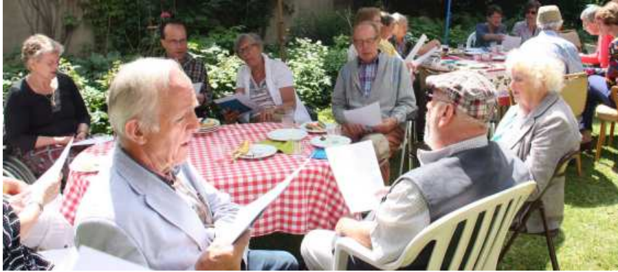
Na het bijpraten tijdens koffie en lunch werd er ook samen gezongen.

Op zondag 15 juni werd de jaarlijkse vrijwilligersdag gevierd. In de tuin van de pastorie was het weer goed toeven. Een fotoverslag: