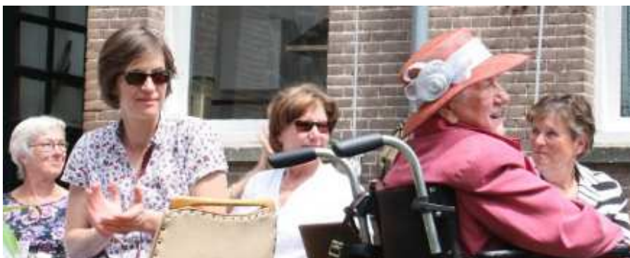
Een groot applaus voor alle vrijwilligers!