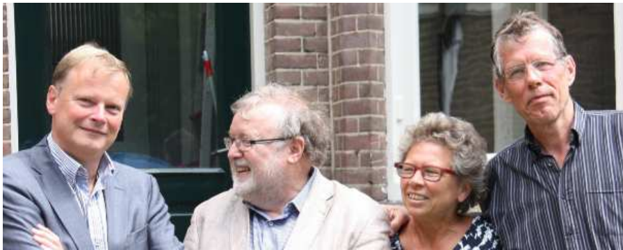
Heel veel dank aan het oude bestuur.