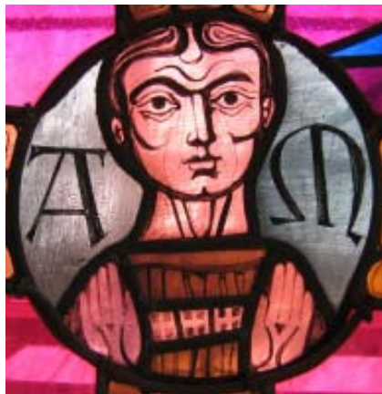
De centrale afbeelding in het roset van het westelijke transeptraam